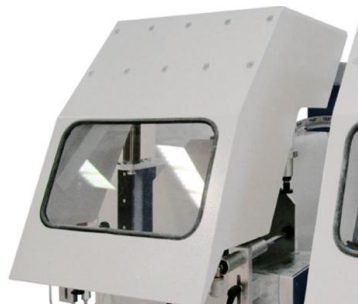
Κάλυμμα προστασίας δίσκων